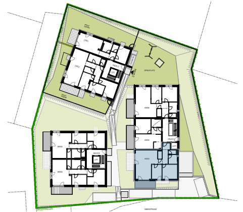
AW 04 84,78 m 2